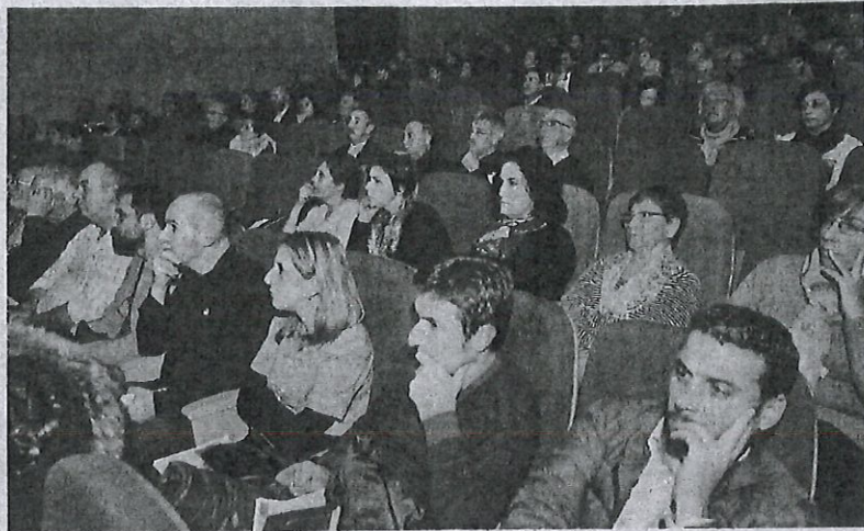
Decenas de estradenses acudieron a conocer de primera mano la iniciativa. MIGUEL SOUTO

En torno a la misma hora, Forcarei fue escenario de otro accidente de tráfico, esta vez en la carretera Lalín-Cachafeiro. Un Opel Astra con matrícula 4181 BYN sufrió una salida de vía a la altura del kilómetro 26,550, entre las localidades de Aciveiro y Cachafeiro. El coche se salió de la calzada por su propia mano e impactó contra un talud lateral de la carretera. Tras el impacto, el automóvil volvió a la calzada y quedó inmovilizado en mitad de un carril, por lo que fue necesaria su retirada con una grúa para liberar la calzada. El conductor resultó ileso.